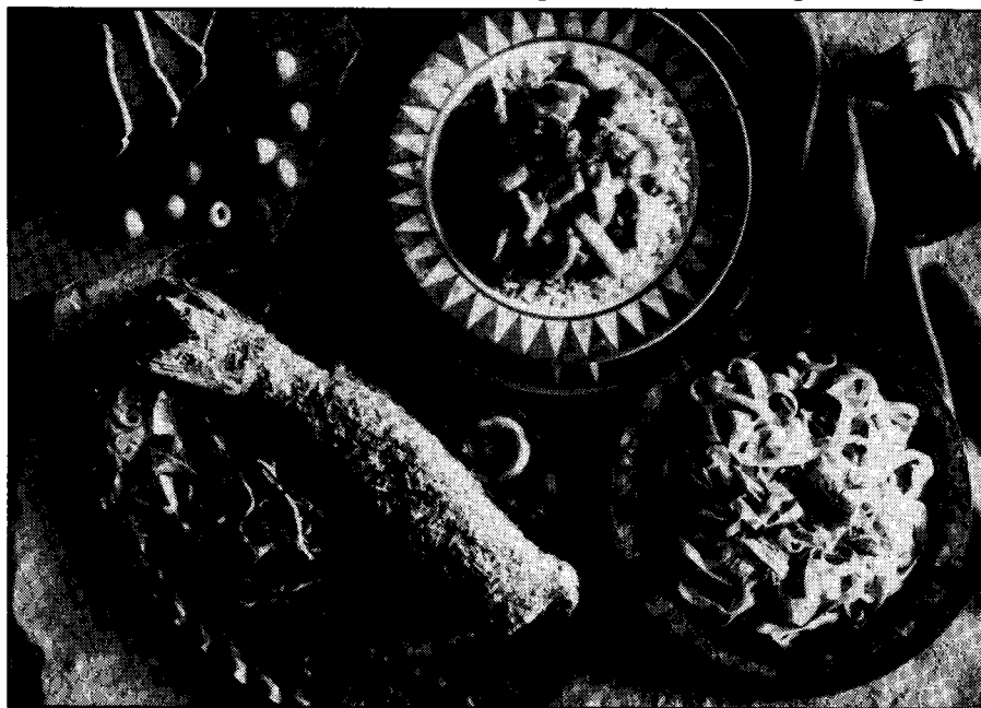
El bagre se puede preparar de muchas maneras; se puede asar, hornear o preparar a la parrilla.

Por lo usual el bagre se puede almacenar en su refrigerador a 32° a 38°F por uno o dos días. A temperaturas más altas de 38°F bacterias se reproducen rápidamente y causan que el pescado se eche a perder. Si usted congela el bagre,